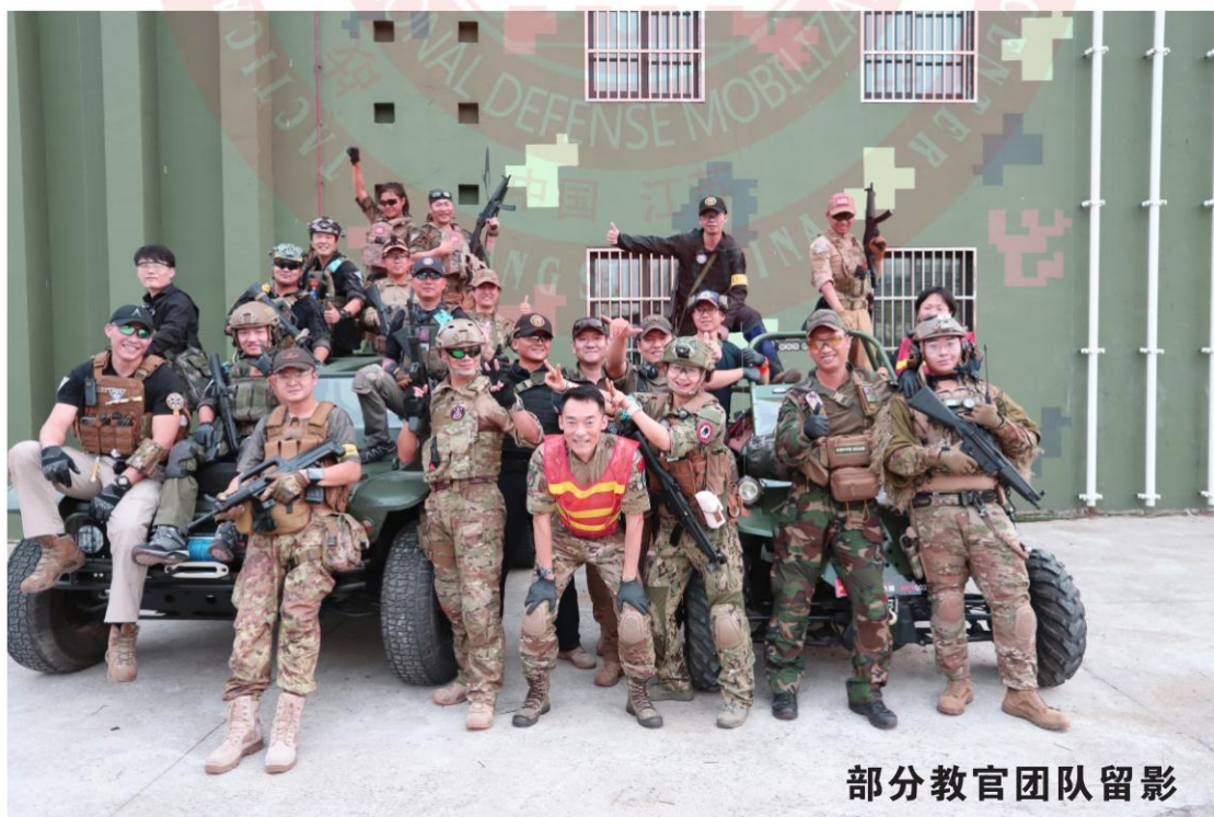
部分教官团队留影

2019年经中国医学救援协会卫生应急管理委员一届二次委员会议通过，聘请为卫生应急管理委员会主任委员会，副主任委员。